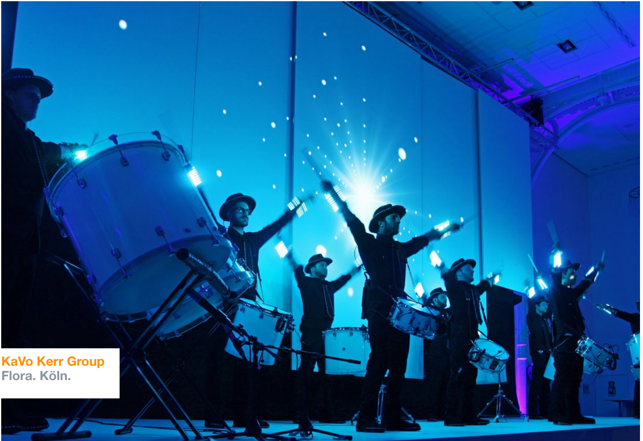
KaVo Kerr Group Flora. Köln.